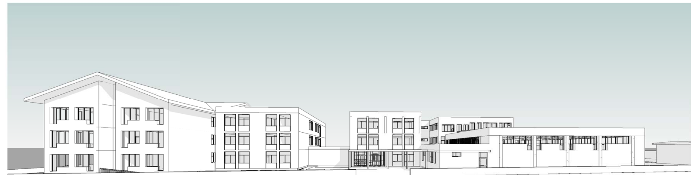
8 Vista 3D Est