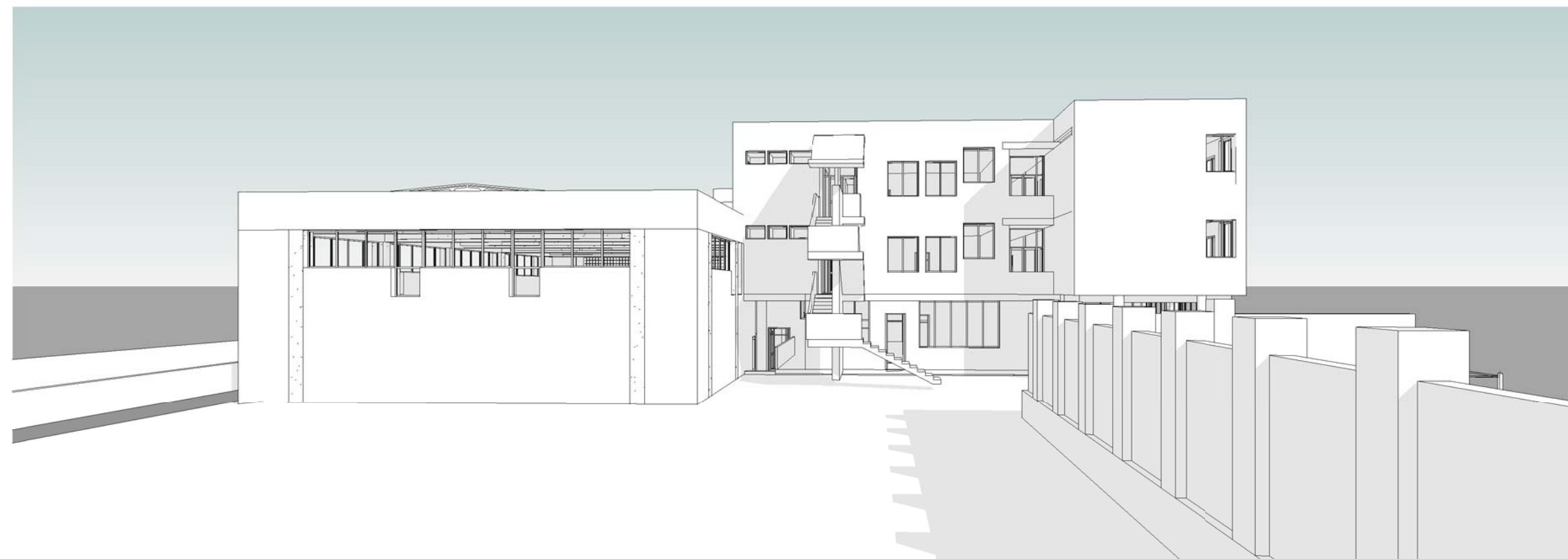
6 Vista 3D Nord