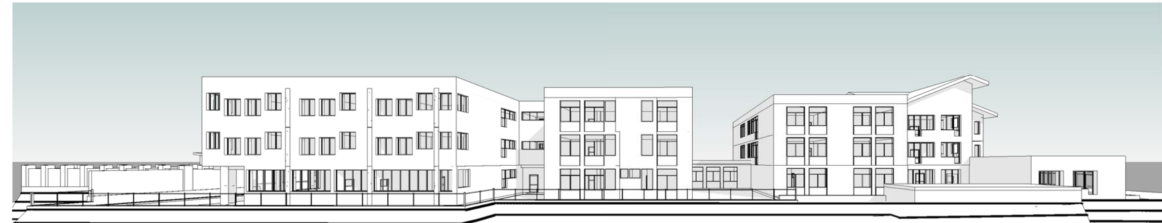
9 Vista 3D Ovest