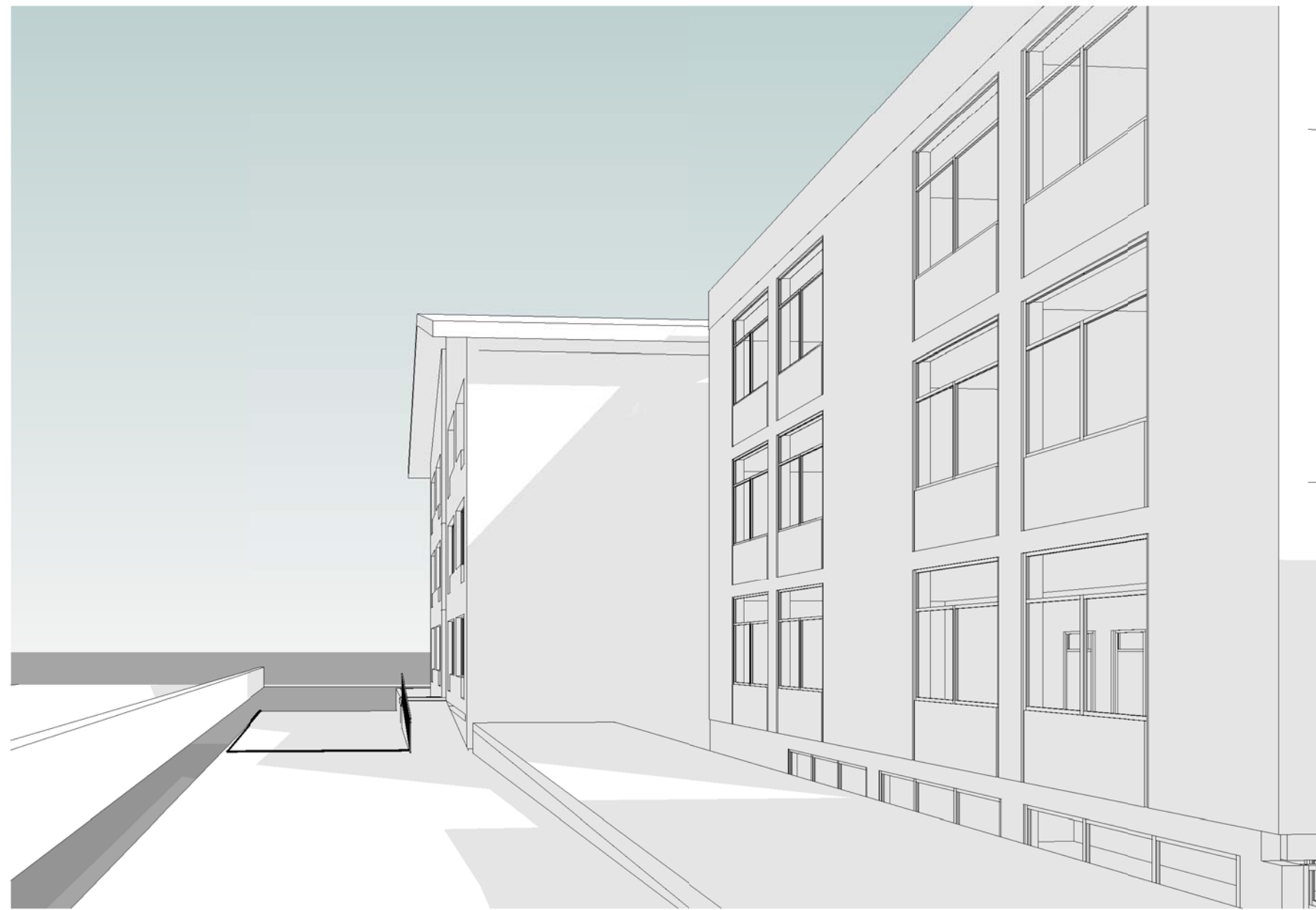
7 Vista 3D Est